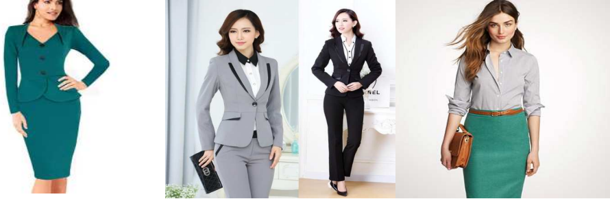
صورة رقم (١١) نموذج لزي يرتدى في الحفلات الرسمية

هي الملابس التي تستخدم في الأفراح وأعياد الميلاد والمناسبات الخاصة ويتميز هذا النوع من الأزياء بتمازج خاصة تتسم بالجمال كما في صورة رقم (١٢) ، ويمكن أن تتأثر أطوالها تبعاً لتغيرات الموضة كذلك تستخدم فيها الكلف المختلفة ومكملات الزينة بدرجة واضحة وملحوظة عن ملابس العشاء. (هاجر سعيد ، ٢٠١٠ ، ص ٢٢٩ )