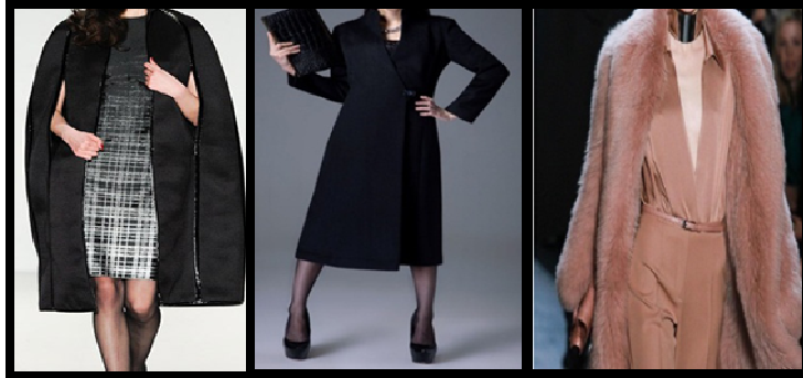
صورة رقم (١٣) نموذج لمعاطف المساء والسهرة

تتمتع معاطف المساء عادةً بالأقمشة الفاخرة فيما ان تكون مطرز أو من قماش حريري أو مخملي يزين بالكريستال أو يكلف من الفرو أو من ريش النعام ويتميز بالأناقة كما في صورة رقم (١٩).