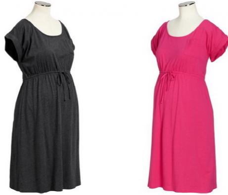
صورة رقم (٣) ملابس خفيفة الوزن للمرأة الحامل مصنوعة من القطن