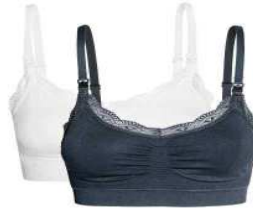
صورة رقم (٧) مشدات حمالات للصدر تستخدمها المرأة أثناء فترة الحمل