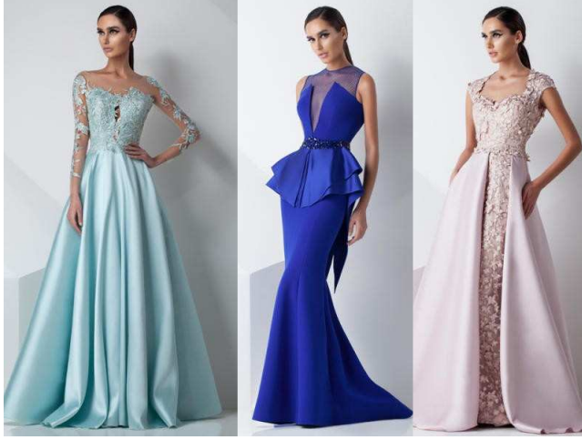
صورة رقم (١٢) نموذج لزي يرتدى في السهرات والمناسبات الخاصة ( www.aljamila.com )