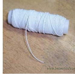
صورة رقم (٦)

شريط مطاطي عريض واخر رفيع يستخدم في ملابس المرأة الحامل