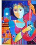
مصدر الاستلهام لوحة المرأة والعزف