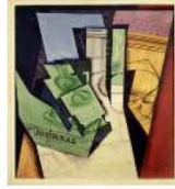
مصدر الاستلهام لوحة طعام الإفطار