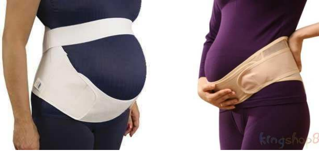
صورة رقم (٨) انواع مختلفة لمشدات البطن للمرأة الحامل ( http://forum.hwaml.com )

■ مشدات البطن (حزام الحمل): إن الغرض من الملابس الداخلية الداعمة الخاصة بمرحلة الحمل هو دعم منطقتي البطن وأسفل الظهر لدى السيدة الحامل دون تقييد تطور نمو الجنين كما في صورة رقم (٨) ، لأن الرحم يصبح أكبر وأثقل بتقدم مراحل الحمل، فيتسبب ذلك في إجهاد وزيادة الضغط على منطقة أسفل البطن، ومنطقة أسفل الظهر بالإضافة إلى منطقة ما بين الفخذين وخاصةً إذا كان الحمل في أكثر من مولود. (سوسن رزق، وآخرون ، ٢٠١٣، ص٢١٣)