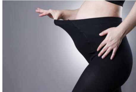
صورة رقم (٤) ملابس مصنوعة من الأقمشة المطاطة للمرأة الحامل