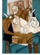
مصدر الاستلهام لوحة الفطور