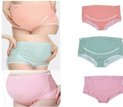
صورة رقم (٩) السروال الداخلي الخاص بالمرأة الحامل ( www.aliexpress.com )