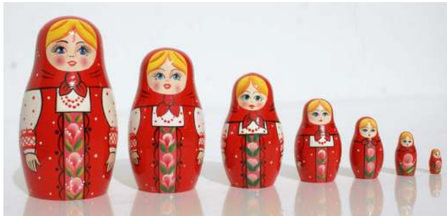
صورة رقم (١٢) الدمية بعد انتهاء كافة المراحل

بعد أن ينتهي الفنان من تلوين الدمى ويضع اللمسات الأخيرة يتم يدويا إضافة طبقة من الورنيش للمحافظة على الألوان ، وإعطاء لمعة مميزه بعد جفاف طبقة الورنيش تصبح الدمى صالحة للعرض كما في الصورة رقم (١٢) .