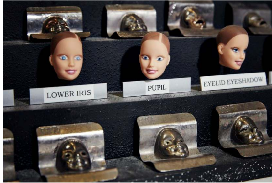
صورة رقم (٢٧) أقنعة لطلاء الاعين

ولكى تبدو عيون الدمي بذلك المظهر المميز فقد ابتكرت الشركة طريقة تعتمد على أقنعة معدنية للوجه مفرغ فيها فتحات للعين كما فى الصورة رقم (٢٧) لرش مخضب ذو قاعدة مائية مطورة