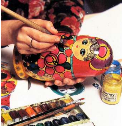
صورة رقم (١١) التلوين اليدوي للدمية ماتريوشكا

بعد ذلك تلون الدمية باستخدام فرش يدوية بمهارة ودقة وتناسق ن كما في الصورة رقم (١١) ، ثم تكرر التلوين لباقي الدمى .