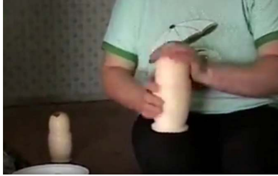
صورة رقم ( ٩ ) معالجة السطح بزيت بذرة الكتان

بعد التأكد من الإنسيابية والنعومة تزال الدمية من المخرطة ، ومن ثم تعاد الاجراءات السابقة مرات ومرات حتى يحصل على عدد الدمى المطلوبة والتي عادة ما تتراوح بين ثلاثة إلى خمسين دمية ، بعدها يتم معالجة السطح الخارجى للدمى بزيت بذرة الكتان كما هو موضح بالصورة رقم ( ٩ ) ، وفى العادة تتم يدويا بدون استخدام أدوات .