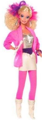
صورة رقم ( ١٧ ) باربي الثمانينيات