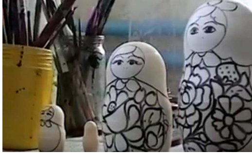
صورة رقم (١٠) زخارف الدمية

بعد ذلك تلون الدمية باستخدام فرش يدوية بمهارة ودقة وتناسق ن كما في الصورة رقم (١١) ، ثم تكرر التلوين لباقي الدمى .