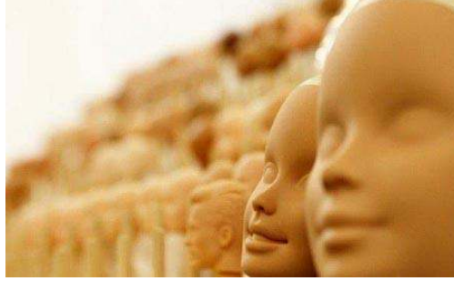
صورة رقم (٢٦) رؤوس دمي باربي

ولكى تبدو عيون الدمي بذلك المظهر المميز فقد ابتكرت الشركة طريقة تعتمد على أقنعة معدنية للوجه مفرغ فيها فتحات للعين كما فى الصورة رقم (٢٧) لرش مخضب ذو قاعدة مائية مطورة