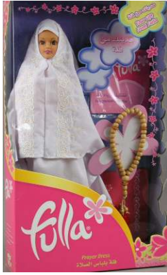
صورة رقم (٢١) فلة