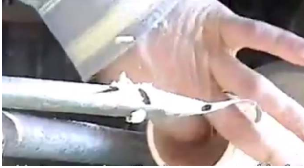
صورة رقم (٦) تفريغ أجزاء الدمية

يتم تفريغ أجزاء الدمية كما هو موضح بالصورة رقم (٦) باستخدام أزميل مخصص لهذا الغرض مع الحذر حتى لا تتلف الحواف الخارجية والتي سيتم من خلالها تجميع أجزاء الدمى .