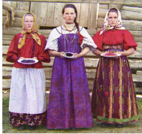
صورة رقم ( ٣ ) فلاحات روسيات بالملابس التقليدية صورة رقم ( ٤ ) طفلة بالملابس المحلية

وليومنا هذا تعد إجراءات صناعة دمي ماتريوشكا بنفس الإجراءات التقليدية التي توارثتها الاجيال ، وتبدأ بأن يقوم أفراد بقطع الاشجار بالقرى كخطوة أولى ، ويفضل خشب الصندل والزيزفون والزان .