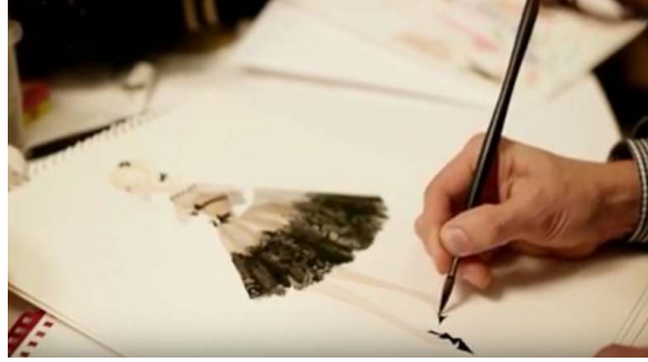
صورة رقم (٢٩) تصميم الأزياء

على التوازي يقوم فرق عمل آخر بتصميم وتنفيذ ملابس والدمية فيقوم أولاً مصمم أزياء بوضع خطوط التصميم كما في الصورة رقم (٢٩) .