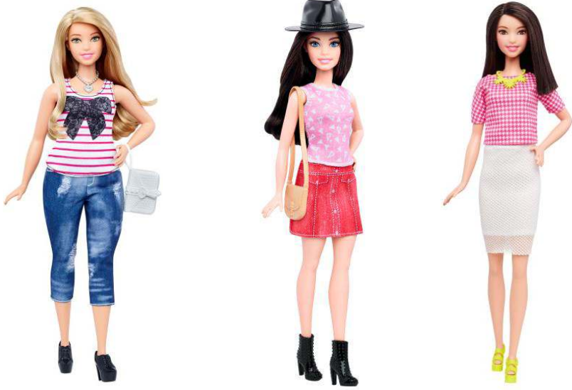
صورة رقم (٢٣) تصميمات حديثة لباربي