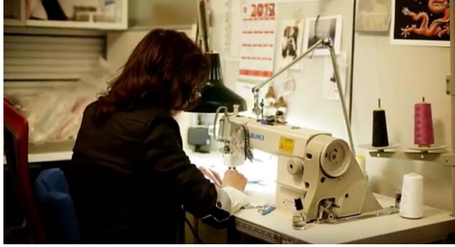
صورة رقم (٣١) حياكة الاقمشة

يتم حياكة الاقمشة لتنفيذ الرداء بواسطة ماكينات الخياطة كما هي موضحة بالصورة رقم (٣١).