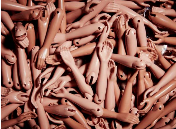
صورة رقم (٢٥) أذرع دمي باربي

تستخدم القوالب الدوارة للحصول على منتجات سواء مفرغة أو مصمته لكافة الحجم المتاح وحتى أكثرها دقة وأقلها سمكاً، ومواكبةً للتطور التقني في الخامات لتحقيق نتائج أفضل ؛ فقد إتجهت شركة ماتيل إلى تصنيع أذرع دمي باربي من مركب خلات فاينيل- إيثيلين Ethylene-vinyl acetate ويعرف إختصاراً EVA والذي يتم تركيبه من الايثيلين والفينيل الحمضي كما في الصورة رقم ( ٢٥ ) .