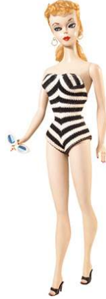
صورة رقم (١٣) التصميم الاول

قادر فريق البيتلز Beatles غزوا موسيقيا بريطانيا واكبته باربي من خلال اصدارة قابلة لثنى الجذع تستطيع اداء رقصات مع ابن عمها ستاسى Stacey الناطق بلهجة انجليزية مرحة . كما اصدارة لباربي تحاكي تصفيفة شعر السيدة كنيدي وترتدى زى وزارة الدفاع الامريكية متعدد الالوان