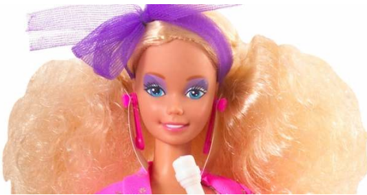
صورة رقم ( ١٨ ) وجه باربي الثمانينيات

وقد احتلت باربي ولاول مره لوحات اعلانية كبيرة على الطرق السريعة تظهر في اطلالة ملائكية .