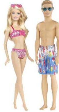
صورة رقم (٢٠) باربي وكين

في ٢٠٠٩ احتلّت باربي من خلال اسبوع الموضه برعاية مرسيدس بنز بالذكرى الخمسين بمنزلها حلم مالمبو .