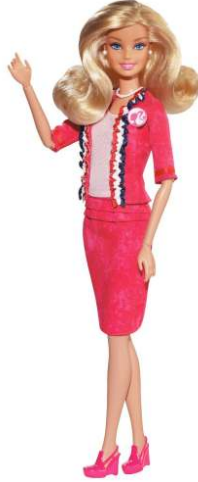
صورة رقم ( ١٩ ) اصدار باربى كمرشحة للرئاسة

فى عام ١٩٩٢ والذى عرف بعام المرأة فى السياسة تم انتخاب ٢٤ امرأة لعضوية مجلس النواب وعلى اثر ذلك تم اصدار نموذج باربى كمرشحة رئاسية كما فى الصورة رقم (١٩) مما تبع ذلك تعديلات تصميمية حيث زاد ارتفاع الدمية ليصل الى ١٠ بوصة اى ما يقرب من ٢٥ سم لتصبح الاكثر طولاً من اى وقت مضى كما تم تعديل فى الثياب باضافة وسائد للاكتاف لتبدو اكثر عرض.