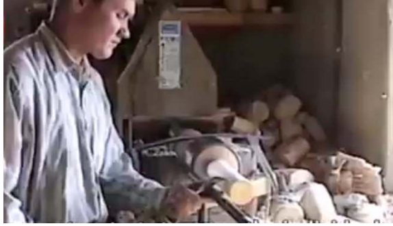
صورة رقم (٥) خراطة أجزاء الدمية

يتم تفريغ أجزاء الدمية كما هو موضح بالصورة رقم (٦) باستخدام أزميل مخصص لهذا الغرض مع الحذر حتى لا تتلف الحواف الخارجية والتي سيتم من خلالها تجميع أجزاء الدمى .