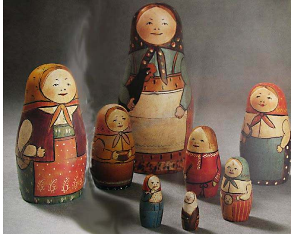
صورة رقم (٢) أول دمية تداخل روسية

لم تتغير تقنيات صناعة الدمية منذ نشأتها وحتى الان وهى متوقفة علة مهارة الحرفى القائم بخرط الاخشاب ، عادة ما يتم قطع الاخشاب فى اوائل الربيع ثم يتم اذالة اللحاء ثم تجفف الاخشاب ويقوم الخراط بما يوازي خمسة عشر اجراء لتصل الدمية الى شكلها النهائى . قام مالبوتين بتلوين الدمية تبعا للتصميم الذى وضعه سابقا والذى استلهم موضوعه من خلال مشاهدته للحياة اليومية الروسية والتي حاكى فيها أم فلاحه روسية لها سبع فتيات كما فى الصورة رقم (٢) ليصير مجموع القطع المتداخلة ثمان قطع وقد عرض هذا النموذج مع نماذج اخرى عديدة لدمى التداخل بمتحف للالعاب بمدينة سيرجيف بوساد Sergiev Posad بروسيا .