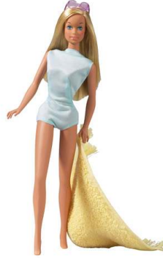
صورة رقم ( ١٥ ) باربي السبعينيات