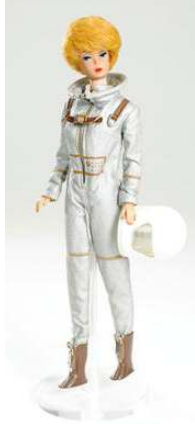
صورة رقم (١٤)