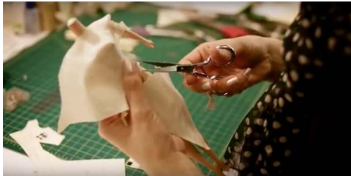
صورة رقم (٣٠) قص القماش

ثم يتم عمل باترونات واختيار الأقمشة أو الخامات المستخدمة استعداداً لحياكتها كما في الصورة رقم (٣٠) .