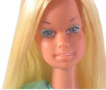
صورة رقم ( ١٦ ) وجه باربي السبعينيات