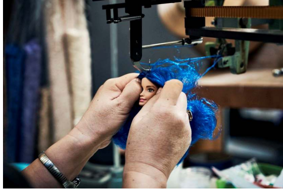
صورة رقم (٢٨) ماكينة صناعة شعر الدمية

على التوازي يقوم فرق عمل آخر بتصميم وتنفيذ ملابس والدمية فيقوم أولاً مصمم أزياء بوضع خطوط التصميم كما في الصورة رقم (٢٩) .