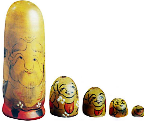
صورة رقم (١) فوكاورما Fuk uruma - دمية يابانية

وفى أحد إجتماعات يوم السبت التقليدية التى يعقدها مامونتوف جلب أحدهم دمية يابانية تدعى فوكاورما Fuk uruma وهى مكونة من سبع نماذج متداخلة لرجل مسن ، وعلى الجانب الاخر يقال ان النموذج الاول من الدمي المتداخلة منشأه جزيرة هونشو Honshu اليابانية وقد ابتكرها راهب روسى كما هو موضح بالصورة رقم (١).