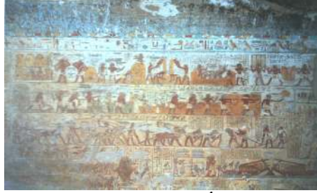
شكل (٧) مشاهد الزراعة بمقبرة "باحيري" الأسرة ١٨ الدولة الحديثة عصر "تحتس الثالث" ١٤٥٠ ق.م. Regine Schulz, Matthias Seidel :Egypt The World of The Pharaohs, The American University in Cairo Press,p360

ثلاثة ، وتكرار الوجوه في وسط اللوحة يشعرون بالعدد العفيري ، وتوجد ثمة توازي لخطوط الأقسام القائمة ، وقد برع الفنان المصري القديم في إبراز معالم الحزن والبكاء على وجوهن . (٤) الزراعة: (مشاهد متتابعة - درامية - لعملية الزراعة مقبرة "باحيري"، الدولة الحديثة) .