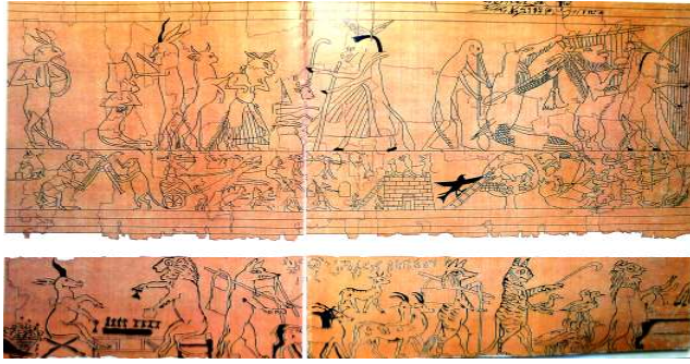
شكل (١٠) بردية ساخرة (متحف تورينو، لندن)

F. Priss d'Avennes :Atlas of Egypt Art, The American University 2000,p.71