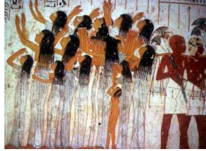
شكل (٥) وشكل (٦) منظر النائحات مقبرة " رع - مس "