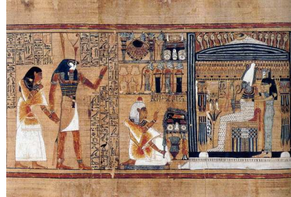
شكل (١١) الحدث الأول محكمة الموتى - طيبة - بردية