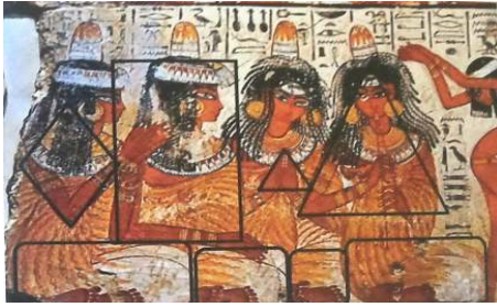
شكل (٤) تفصيلا من الشكل السابق توضح التكوين في بناء اللوحة