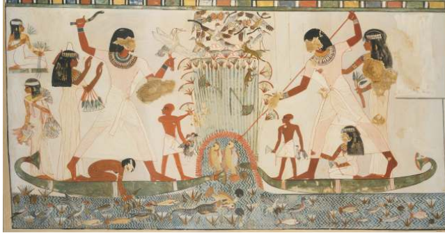
شكل ( ٢ ) منظر الصيد والقنص بمقبرة مننا - الأقصر . نقلا عن

(١) الصيد والقنص : ( لوحة الصيد والقنص مقبرة " مننا " - الأقصر ) .