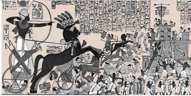
شكل (٩) صورة توضيحية الملك "رمسيس الثاني" معتليا مركبته الحربية ، معركة قادش

Dominic Rathbone : Civilizations of The Ancient World, thames& Hudson, United Kingdom, London, 2009, p 34 .