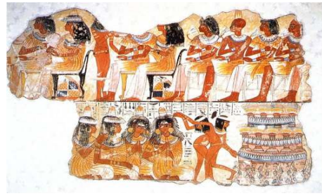
شكل (٣) من مناظر الحفلات الموسيقية والولائم والمآدب مقبرة نب آمون مقبرة رقم ٩٠ " مقابر طيبة الغربية " الدولة الحديثة الأسرة ١٨ .