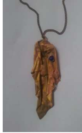
شكل رقم (٥)