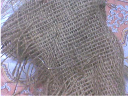
شكل رقم (٢)

وعلى هذا تحاول الباحثة الكشف عن الخصائص التشكيلية والجمالية لملامس الخامات المصنعة لاستلهاام تكوينات فنية مستحدثة لإثراء مشغولات الحلى المعدنية .