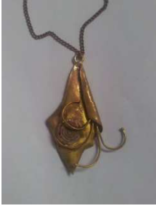
شكل رقم (٨)