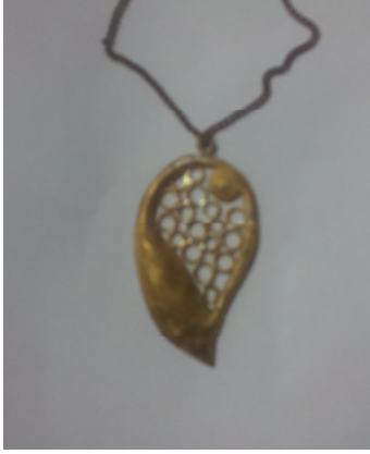
شكل رقم (٦)

دلالية صدر شكلت باستخدام شريحة من النحاس الأصفر بسمك (٨) ، وأسلاك نحاس أصفر بسمك (٢ومم) ، اعتمدت على الاستفادة من ملامس خامة القماش ، وتم تشكيلها باستخدام أسلوب التشكيل بالبارز والغائر والتشكيل بالقطع ، والحنى ، مع استخدام عملية اللحام بالفضة .