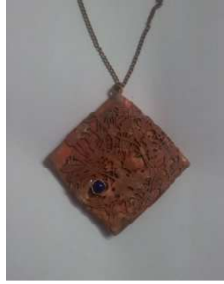
شكل رقم (٧)