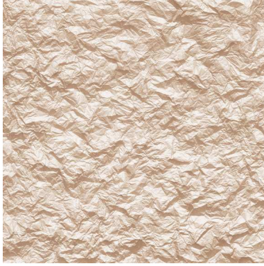
شكل رقم (٤)