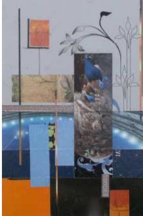
اللوحة رقم (٦)