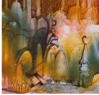
اللوحة رقم (٢) من عمل الباحث