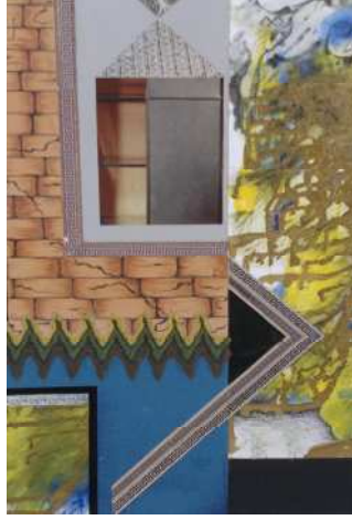
اللوحة رقم (٤)