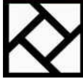
شكل (١) المفروكة