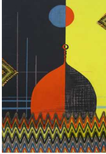
اللوحة رقم (١)