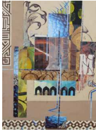
اللوحة رقم (٣) من عمل الباحث

• التقنية المستخدمة في العمل : الطباعة علي الورق باستخدام الجواش