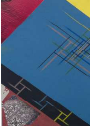
اللوحة رقم (٥)