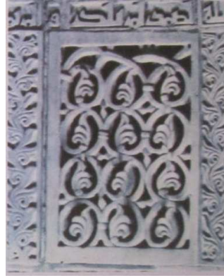
شكل (٤) الرقش النباتى