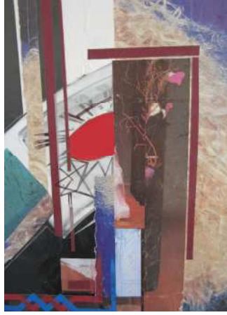
اللوحة رقم (٧)