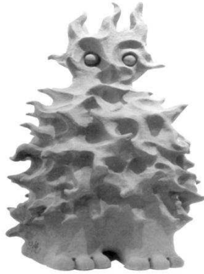
الشكل رقم (١)