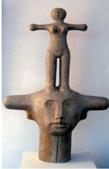
الشكل رقم (٢)