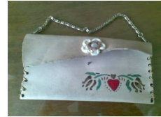
شكل رقم ١- ب المستوى ب