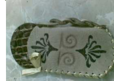
شكل رقم ١- ج المستوى ج