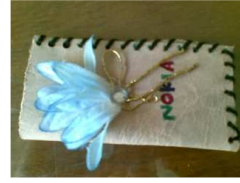
شكل رقم ١- أ مستوى ا