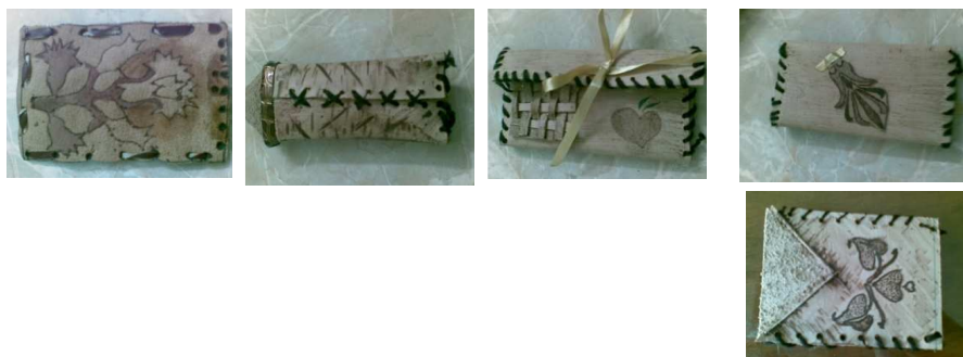
شكل رقم ١ - د المستوى د

يوضح الجدول رقم ٥ الفروق بين متوسطات الطلاب في درجات بطاقة الملاحظة للمنتج في المهارات الثلاثة (الطلاقة والاصالة والمرونة) والدرجة الكلية.