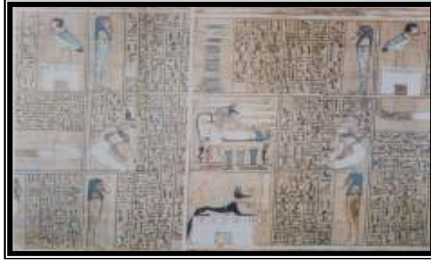
شكل رقم ٤ (غرفة المومياء في بردية آني)