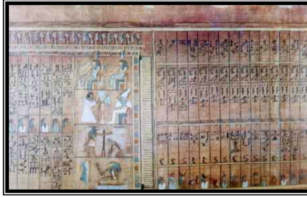
شكل رقم ١١ (تأليه أعضاء آني)