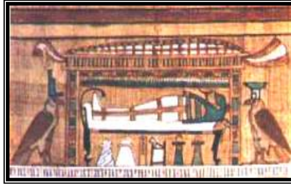
شكل رقم ١٢ (مومياء آني على تابوت داخل ناووس)