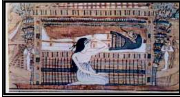
شكل رقم ١ (مومياء آني في الموكب الجنائزي)