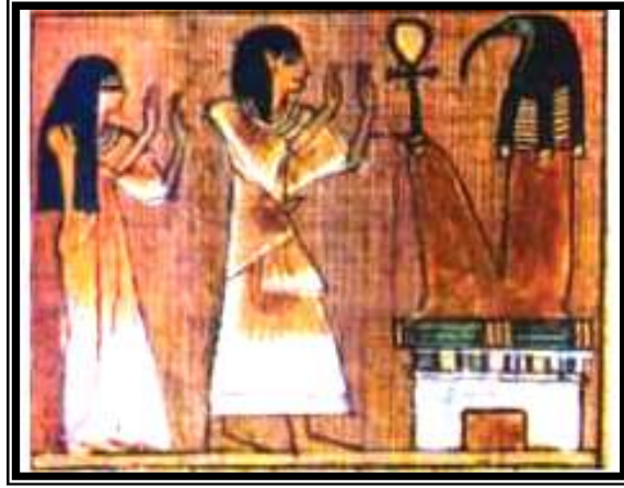
شكل رقم ١٣ (أنى وزوجته يبتهلان إلى تحوت)