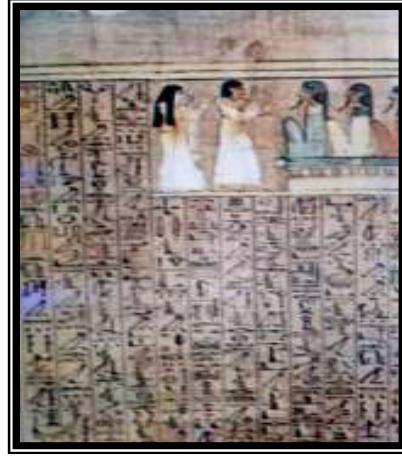
شكل رقم ٨ (أبناء حورس)