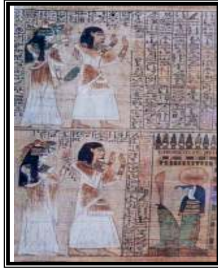
شكل رقم ١٤ (الدخول إلى القاعات والبوابات)