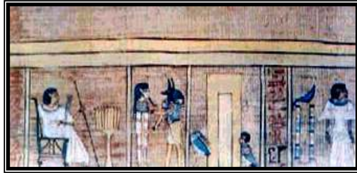
شكل رقم ٥ (عدم الدخول إلى صخرة النبح)