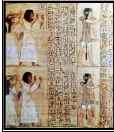
شكل رقم ١٠ (كاهنان يقدمان آني وزوجته إلى الآلهة)