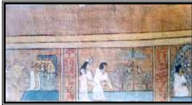
شكل رقم ٩ (عدم السماح لقلب المرء أن يؤخذ منه)