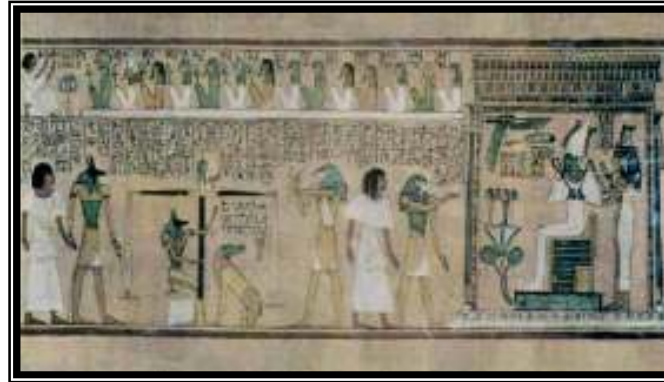
شكل رقم ٦ (منظر المحاكمة)