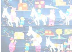
شكل رقم (ب٤)

وهو عبارة عن وحدات تكون أحياناً متشابهة أو مختلفة عن بعضها البعض من الخامات المنسوجة ويتم قص كل وحدة على حدة، ثم توضع على الأرضية في أماكنها المحددة ليكتمل التصميم، وغالباً ما تكون هذه الخامات مختلفة الألوان عن بعضها، وعن لون لأرضية، وقد توضع كل وحدة بجانب الأخرى مباشرة، أو توضع بعض الوحدات على الأخرى من أطرافها ثم تثبت هذه الوحدة بغرز مرئية أو غير مرئية حسب التصميم، ويكون عادة خط التثبيت من خامة ولون مخالفين لإحداث نوع من التوليف المنسجم بين أكثر من خامة أو أكثر من لون في التصميم الواحد. (١)