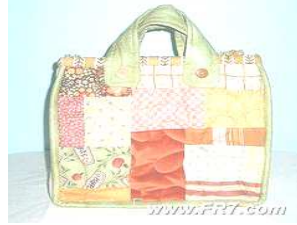
شكل رقم (١٥)

شكل رقم (١٥ - هـ) يشير إلى فن التوليف بأسلوب المرقعات بمساحة واحدة