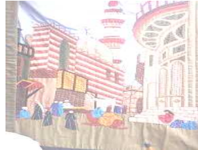
شكل رقم (أ٤)

شكل رقم (أ٤ - ب٤) يشيران إلى فن التوليف بأسلوب المرقعات على هيئة مساحات مختلفة كتلة