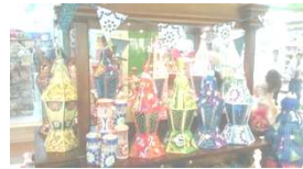
شكل رقم (١٤) يشير الى بعض الاعمال المعروض فى السوق المحلى لفانوس رمضان