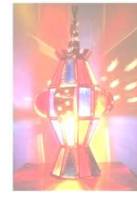
شكل رقم (١١) يشير الى بعض أشكال وأنواع الفوانيس المعروضة بالسوق المحلى