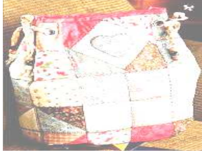
شكل رقم (هـ)

النوع على التغطية الكاملة بحيث تكون هذه الأقمشة الأرضية، تقص القماش من الخامات المختلفة بشكل واحد على هيئة مستطيل ولكن مختلف في طوله وعرضه من قطعة لأخرى مع ترك مقدار خياطة حول كل قطعة وتحاك القطع مع بعضها البعض، وتوضع على مسطح الأرضية، وتثبت بالدبابيس ثم تحاك على الطرف وتشطب مع الأرضية. (١)