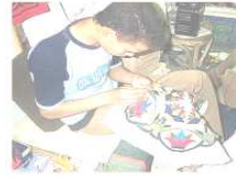
شكل رقم (١) يشير الى استخدام زهرة اللوتس الفرعونية كوحدة زخرفية في فن الخيامية