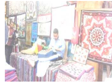
شكل رقم (أ)

شكل رقم (أ - ب) يشير إلى بعض الأعمال الفنية المعروضة بشارع الخيامية