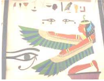
شكل رقم (٢) يشير الى استخدام النقوش الفرعونية في فن الخيامية

كذلك فإن زخارف الملابس وكذلك المصاغ والحلي من وحدات متماثلة هناك رسوم مطرزة علي هيئة أشرطة بالألوان مثبتة علي قطعتين من الكتان من رداء الملك توت عنخ آمون .