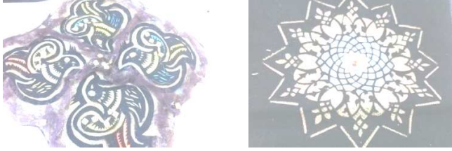
شكل رقم (١٣) يشير الى استخدام الشمواه المفرغ بطريقة الاستنسل

واستخدام قطع القماش الملون من الخيش والستان بطريقة المرقعات