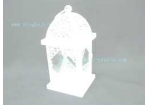
شكل رقم (١٢) يشير الى اطار من الخشب لفانوس رمضان

كما تتلخص طريقه عمل وحدات الاضاءه (فانوس رمضان) بالخياميه للبحث الحالى