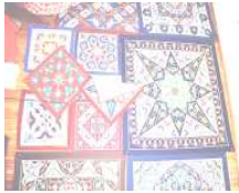
شكل رقم (ب)

وقد امتدت صناعه الخيامية في مصر حتى الآن وهناك مناطق اشتهرت بهذه الصناعات، أمام باب زويلة بالقرب من منطقة "تحت الربيع" يسمى بشارع الخيامية وهو أحد أشهر أسواق القاهرة المسقوفة والذي يقع على امتداد شارع المعز وقد سمي بهذا الاسم نسبة لتلك الحرفة، فما أن تدخل ذلك الشارع حتى تجد على جنباته مجموعة من الورش التي تخصصت في هذا النوع من التراث الفني العريق. وهذا الشارع موجود منذ العصر الفاطمي وهو يتكون من طابقين وقد كان باب زويلة يغلق ليلاً ويفتح في النهار وكان يسمح للتجار بالدخول صباحاً لمباشرة أعمالهم، وأماكن الورش كانت قديماً إسطبلاً للخيول والطابق الذي يعلوه كان أماكن لمبيت التجار الذين يأتون من المغرب والشام، وقد كان لهؤلاء التجار خيام يستخدمونها في سفرهم، وكانوا يعملون على إصلاحها في تلك المنطقة، كما كان يحرض كل منهم أن تختلف خيمته عن الخيام الأخرى ومن هنا بدأت مهنة الخيامية (١) .