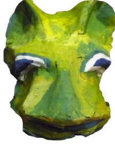
مشغولة رقم (٢ - ٢)