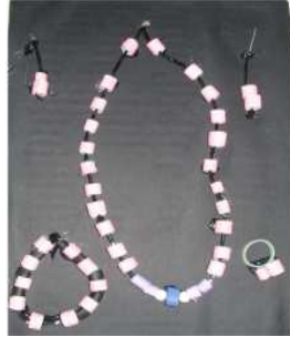
مشغولة رقم (٨ - ٥)