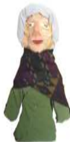
مشغولة رقم (٣- ٤)