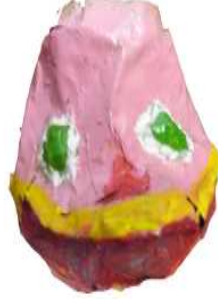
مشغولة رقم (٢ - ٤)