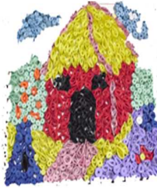
مشغولة رقم (٥ - ٤)