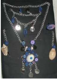
مشغولة رقم (٨ - ٣)

ثامنا: أعمال النشاط الثامن المنفذة وعددها ٥ أعمال وهي موضحة كالتالي: