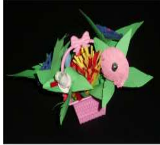
مشغولة رقم (٦- ٥)