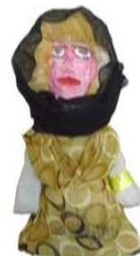
مشغولة رقم (٣- ١)