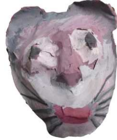
مشغولة رقم (٢ - ١)