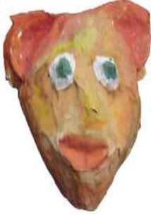
مشغولة رقم (٢ - ٣)

ثانيا: أعمال النشاط الثاني المنفذة وعددها ٥ أعمال وهي موضحة كالتالي: