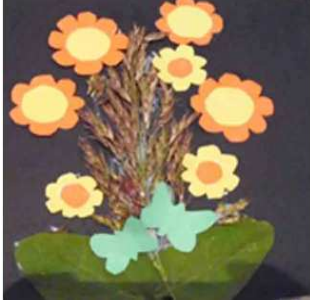
مشغولة رقم (١- ٣)

أولاً: أعمال النشاط الأول المنفذة وعددها خمسة أعمال وهي موضحة كالتالي