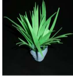
مشغولة رقم (٦- ٤)