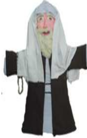
مشغولة رقم (٣- ٣)