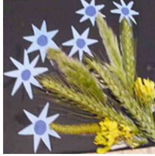
مشغولة رقم (١- ٢)