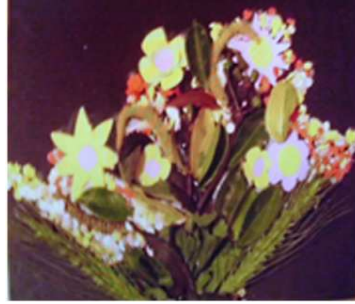
مشغولة رقم (١- ٤)