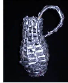
مشغولة رقم (٥ - ١)