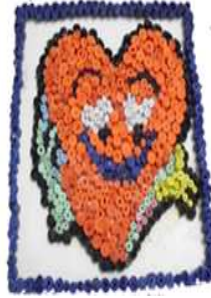
مشغولة رقم (٤ - ٤)