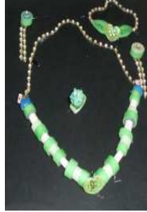
مشغولة رقم (٨ - ٢)