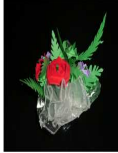
مشغولة رقم (٦- ٢)