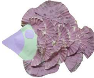
مشغولة رقم (٧ - ٢)