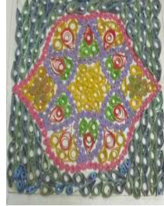
مشغولة رقم (١ - ٤)