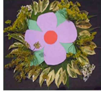
مشغولة رقم (١- ١)