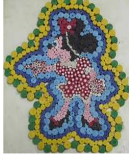
مشغولة رقم (٢ - ٤)