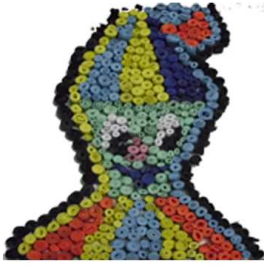
مشغولة رقم (٣ - ٤)

رابعاً: أعمال النشاط الرابع المنفذة وعددها ٥ أعمال وهي موضحة كالتالي: