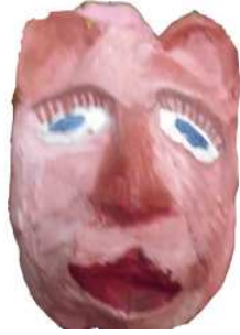
مشغولة رقم (٢ - ٥)