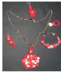
مشغولة رقم (٨ - ٤)

ومن خلال ما سبق أمكن التوصل إلى النتائج التالية :