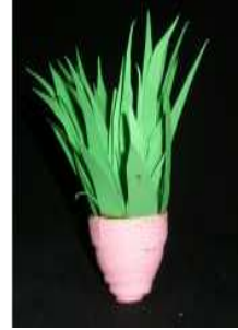
مشغولة رقم (٦- ١)