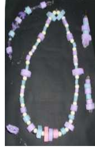
مشغولة رقم (٨ - ١)