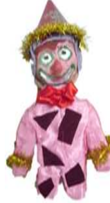
مشغولة رقم (٣- ٤)