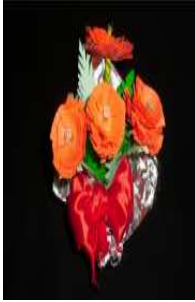
مشغولة رقم (٦- ٣)

سادسا: أعمال النشاط السادس المنفذة وعددها ٥ أعمال وهي موضحة كالتالي: