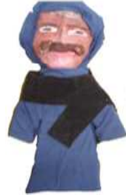
مشغولة رقم (٣- ٢)