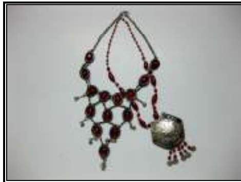
شكل رقم (٤)

المكملات المصنوعة من الفضة والخزف والزجاج والأسلاك المعدنية تناسب ملابس بعد الظهر وملابس المرأة العاملة.