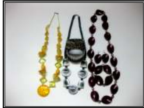
شكل رقم (٣)

المكملات المصنوعة من اللؤلؤ والسلاسل والبلاستيك تناسب ملابس فترة الصباح والزيارات المنزلية