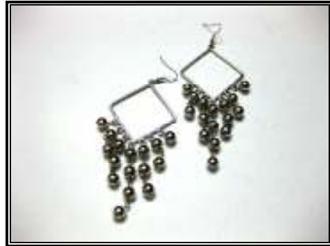
شكل رقم (٦)

المكملات المصنوعة من النواكل* والبلاستيك واللؤلؤ تناسب الملابس فى المناسبات الخاصة (على سبيل المثال بدلة ليلة الحنة).