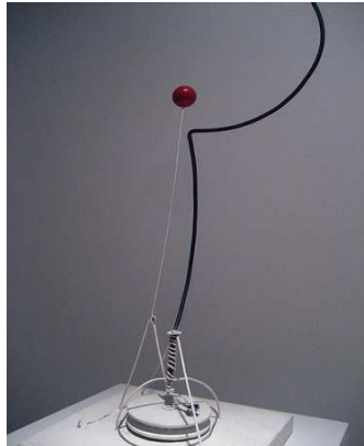
شكل (٣) ألكسندر كالدر

ويجدر الإشارة إلى أن العمل النحتي لا يزول منه آثار المادة أو الخامة بل على العكس تتضافر فيه سائر العناصر المستخدمة في إنشاؤه وتركيبه مع قدرة الفنان لإظهار ثراء المادة ويمكن عن طريق هذا التكامل وإخراج عمل نحتي يستأثر الانتباه وذلك كما تضيفه الخامة من أبعاداً تشكيلية ابتكاريه على الأعمال الفنية النحتية. من حيث الجديد في الأساليب التقنية، ومن حيث إيجاد وسائل تشكيلية جديدة، وحلول جديدة للرؤى التشكيلية تتناسب والأبعاد الفكرية الجديدة لثقافة العصر كما نرى في التكوين النحتي للفنان ألكسندر كالدر شكل (٣)، وتعتمد على الخامة وما نتج عنها من متغيرات فنية وممارسات تشكيلية وبالتالي أصبح النحات باحثاً في الخامة مستثمراً لإمكاناتها، مقدماً الجديد من القيم والمفاهيم الجمالية، مما يؤدي إلى المزيد من الطلاقة الشكلية وحرية التعبير باستخدام خامات عديدة في الشكل النحتي، يتضمن قيماً فنية وتعبيرية وفكرية وفلسفية في شكل حلول تشكيلية للخروج بمفاهيم جمالية جديدة كما في شكل (٤) للفنان عبد الهادي الوشاحي، وشكل (٥) للفنان صلاح عبد الكريم.