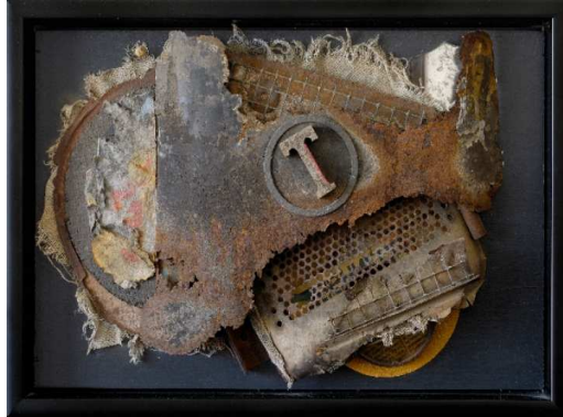
شكل (٦) فلاديمير تاتلين - نحت بارز - ١٩١٥م معدن، خيش، قماش