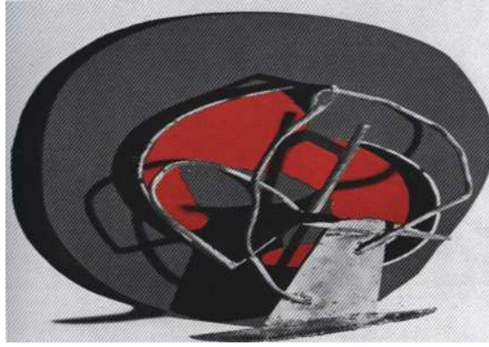
شكل (١) للفنان جاك ويبسين روبرت

وتعد الخامات أساس كل ظاهرة جمالية، فهي تحدد الشكل وتصنع له شروطه فالشكل في العمل الفني يخرج من صياغة المادة، ولكل مادة خواص محددة تسمح لها بصورة معينة من التشكيل، ودور الفنان في سيطرته عليها هو الذي يحدد شكل فئة، والعمل الفني هو تنظيم يحمل فكرة ويجسدها الفنان بالخامة واضعاً كل جوانبها التشكيلية والتعبيرية في اعتباره عند اختيارها لتحقيق القيم التعبيرية وهذه القيم يتطلب إظهارها تقنيات مقصودة من قبل الفنان ليتحصن عن مدى التوافق بين الإمكانيات التشكيلية والتعبيرية للعمل الفني وإظهار الفكرة التي يسعى الفنان لتحقيقها وتقييم العمل الفني جمالياً أصبح قائماً على تفهم دور المادة ومدى إسهامها في تحقيق الأبعاد التشكيلية والتعبيرية وخاصة في الفن الحديث (١)