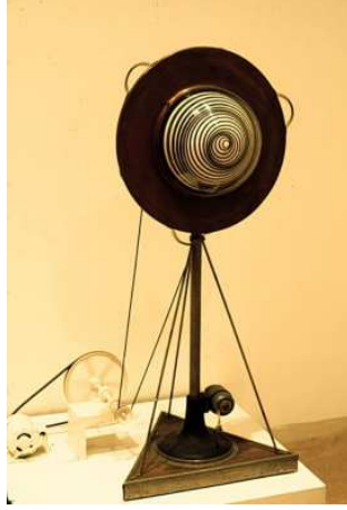
شكل (٨) مارسيل دوشامب الزجاج الدوار باستخدام موتورات ، ١٩٢٠ م