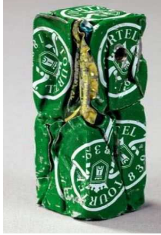
شكل (١٠) الفنان سيزار، علب مضعوفة، ١٩٦٢م المتحف الدولي للفنون الحديثة، باريس.