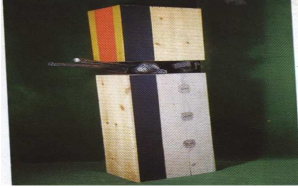
شكل (٢) للفنان دالود هوبرت

الحديث، و كانت هذه الاتجاهات الفنية بمثابة رد فعل لتغيرات الاجتماعية التي حدثت في المجتمع العالمي على المستوى العلمي والتكنولوجي .