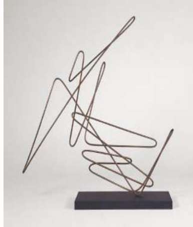
شكل (٩) هانز هيلمن . بناء سلكي ، سلك معدني ، خشب.