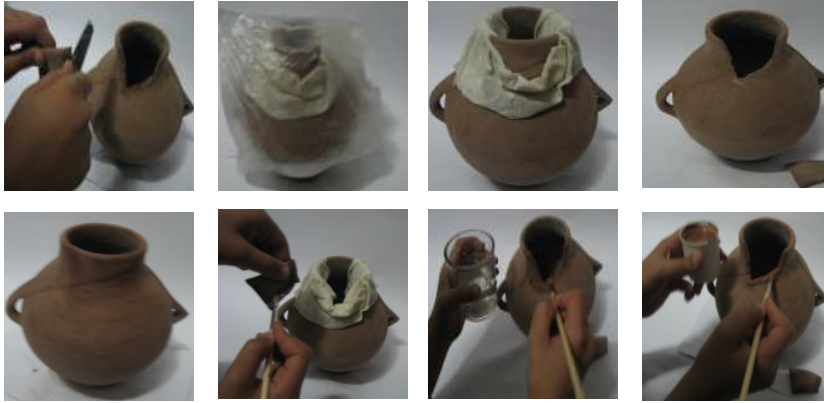
شكل رقم ( ٢ )

عبارة عن إناء خزفي كروي الشكل ذو يدين مشكل بتقنية القالب تعرض لضغط شديد على الفوهة فأدى لكسر جزء منها وهو فى مرحلة الجفاف قبل عملية الحرق .