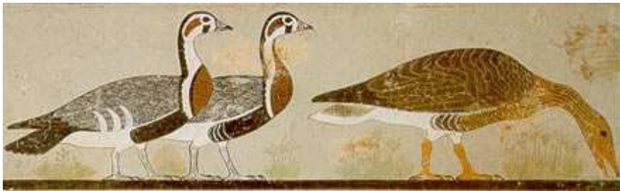
شكل ٢- لوحة - تفصيلية - إوزات ميدوم الست رسم جداري بالألوان وجد في مقبرة "ميدوم" الدولة القديمة