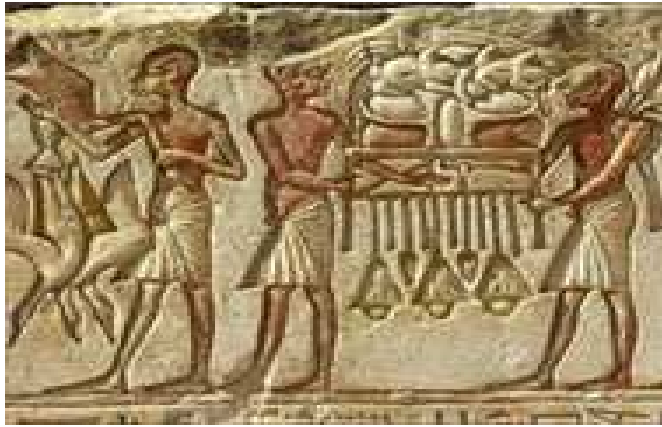
شكل ١- لوحة من مقبرة سي تي الأول ثاني ملوك الأسرة الفرعونية الـ ١٩ في وادي الملوك بالأقصر.

وخلال عصر الدولة القديمة، طور قدماء المصريين الأساليب الفنية والأشكال الزخرفية التي تواصل استخدامها لآلاف السنين.