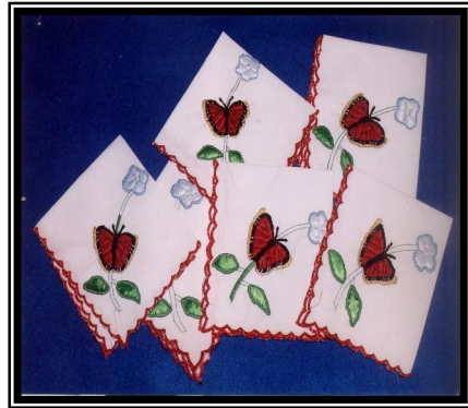
صورة رقم (٩)