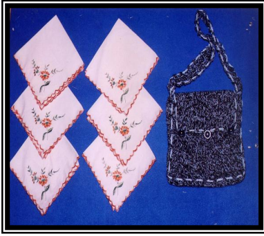
صورة رقم (٦)