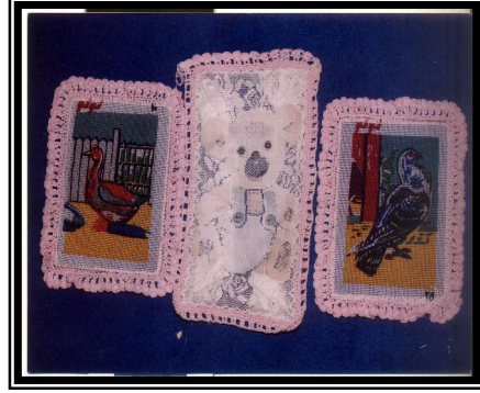
صورة رقم (١١)