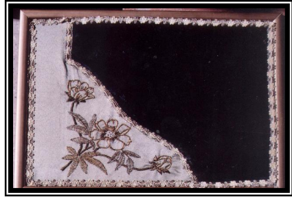
صورة رقم (١)