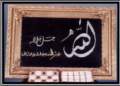
صورة رقم (٢)