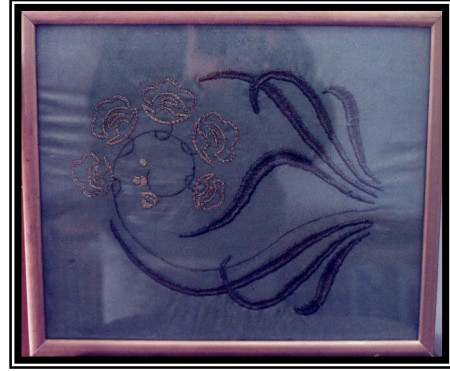
صورة رقم (٧)