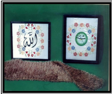
صورة رقم (٤)