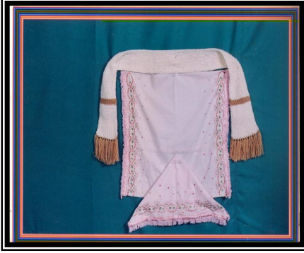
صورة رقم (١٢)