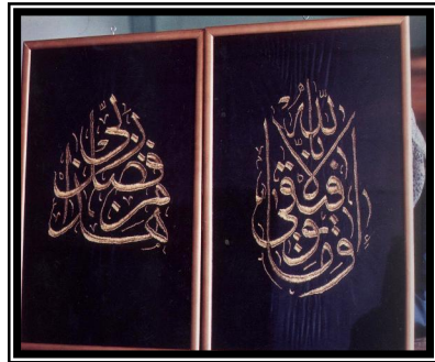
صورة رقم (٣)