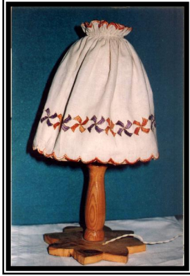
صورة رقم (١٤)