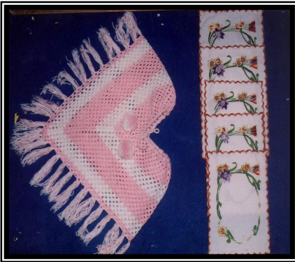
صورة رقم (١٠)