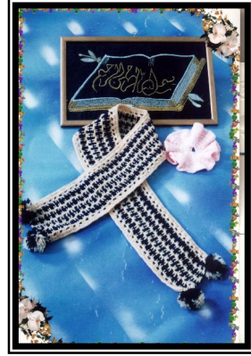
صورة رقم (١٣)