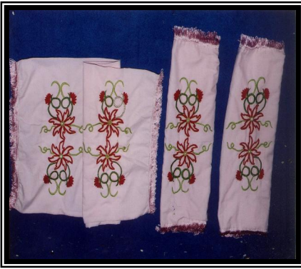
صورة رقم (٨)