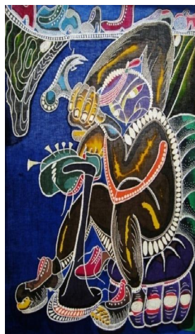
عمل فني رقم (٣)