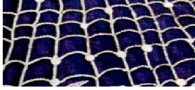
شكل رقم (١١)