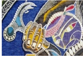
• تماس النقطة واستخدامها في بناء العمل الفني شكل رقم (٢٠)