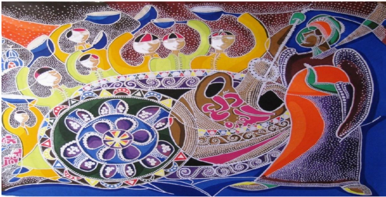
عمل فني رقم (٨) إسم العمل (بائع الفول) الطول والعرض: ٧٠×١٠٠ إتجاه العمل عرضي