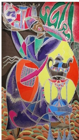
عمل فني رقم (٤)