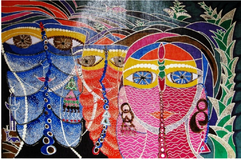
عمل فني رقم (١٠) إسم العمل (الثلاث بنات) الطول والعرض: ٧٠×١٠٠ إتجاه العمل عرضي