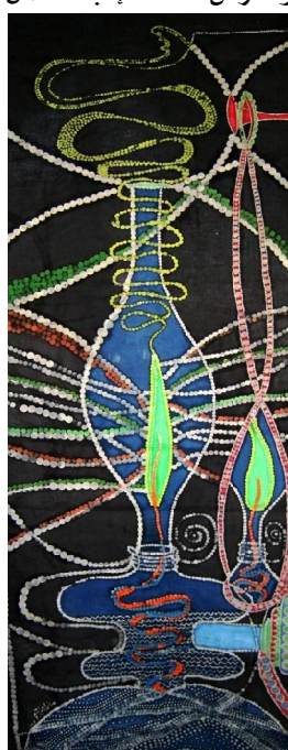
عمل فني رقم (٥)