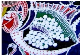
شكل رقم (١٦)

• أحجام واتجاهات وأشكال للنقطة داخل التكوين