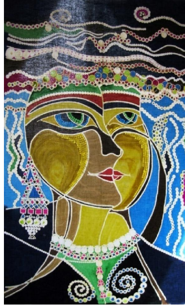
عمل فني رقم (١)