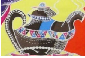
• تماس النقطة واستخدامها في بناء العمل الفني شكل رقم (١٨)