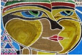
• تماس النقطة واستخدامها في بناء العمل الفني شكل رقم (٢١)

ومما سبق يتضح مدى إمكانيات التشكيل بإسلوب الباتيك بطريقة التنقيط لما لها من متغيرات في الحجم والشكل مكونة صياغات تشكيلية تثري العمل الفني من خلال: