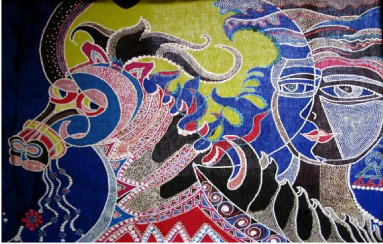
عمل فني رقم (٧) إسم العمل (فتاة وحصان) الطول والعرض: ٧٠×١٠٠ إتجاه العمل عرضي