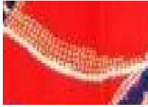
شكل رقم (١٥)