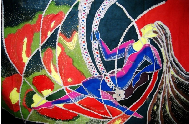
عمل فني رقم (٩) إسم العمل (الأرجوحة) الطول والعرض: ٧٠×١٠٠ إتجاه العمل عرضي