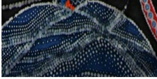
شكل رقم (١٤)