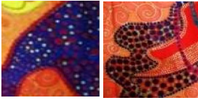
شكل رقم (١٣)