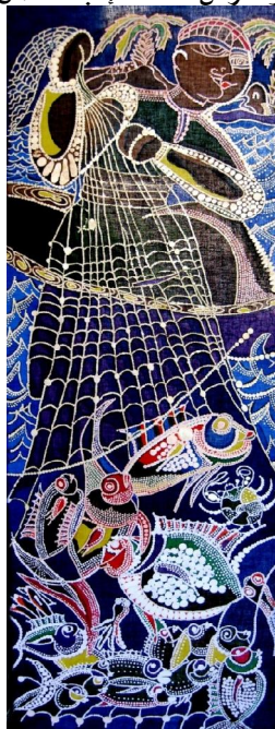
عمل فني رقم (٦)