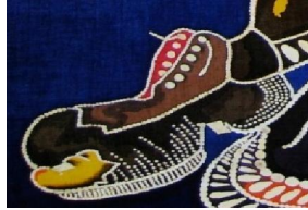
• تماس النقطة واستخدامها في بناء العمل الفني شكل رقم (١٩)