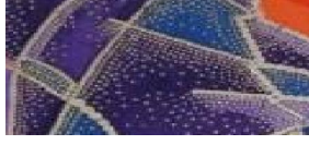
شكل رقم (١٠)