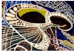
شكل رقم (١٧)

• أحجام واتجاهات وأشكال للنقطة داخل التكوين