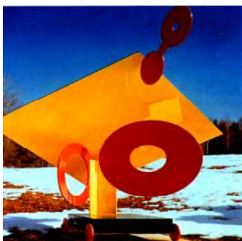
صورة ١ عمل نحتي للفنان ديفيد سميث حيث استخدمت فيه الألوان كعنصر أساسي في إثراء التكوين 1