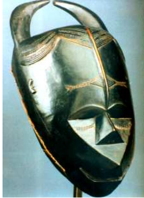
صورة ٤ : بورتوريه من النحت الأفريقي منفذ من خامة الخشب ، استخدم فيه اللون للتخلص من صفات الخامة ١ .

"استطاع اللون يخطو بفض النحت خطوة هائلة عندما اكتشف الفنان قدرة اللون على التحكم في الصفات الظاهرية للخامة. ويساعد اللون الواحد على التخلص من صفات الخامة، حيث يصبح اللون هو الملمس لا الخامة الموجود عليها اللون" 2 ، كما في (صورة رقم ٤). وكثيراً ما نعتقد عندما ننظر لبعض الأعمال النحتية الملونة أنه تم صياغتها من خامة معينة، غير أننا من خلال التدقيق حيث يتبين لنا أن العمل النحتي الذي ننظر إليه مصنوع من خامة أخرى مختلفة تماماً عن توقعاتنا السابقة.