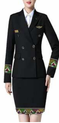
التصميم المقترح الثالث