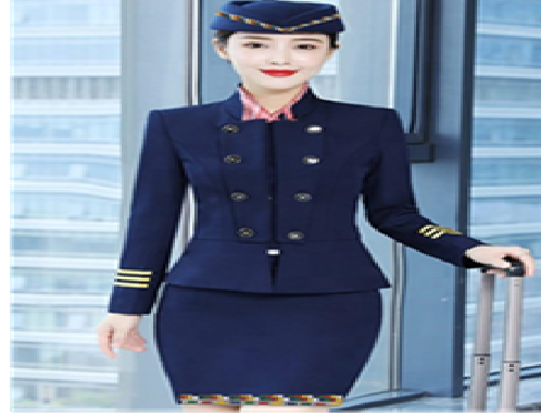
التصميم المقترح التاسع