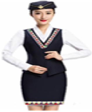
التصميم المقترح (الثانى)