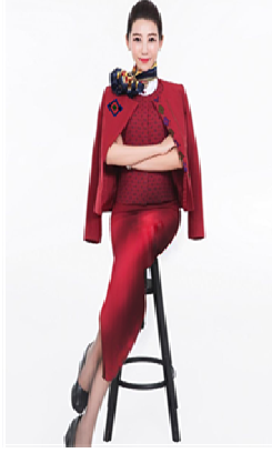
التصميم المقترح الثامن