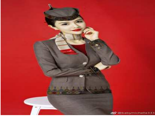
التصميم المقترح العاشر