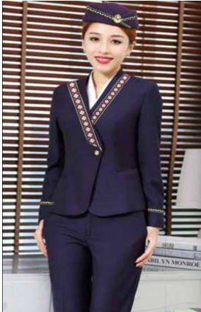
التصميم المقترح السادس