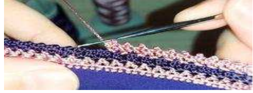
صورة "١" الطريقة الأولى "المباشرة"