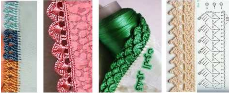
صورة "٩" غرزة المربعات وقشر الحوت والأعمدة المغلفة والقرنفل