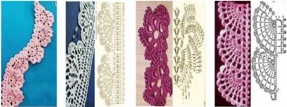
صورة "١٠" غرزة المروحة الفرنسية والوردة ونصف الوردة ورمش الغزال