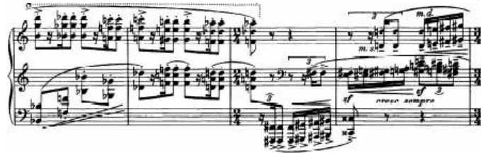
شكل (٨) يوضح التدوين على ثلاثة مدرجات موسيقية في الصوناتا رقم ٣

كما استخدم كارول سيمانوسكي أيضا ثلاثة مدرجات موسيقية للتدوين في العديد من مؤلفاته للبيانو ومنها على سبيل المثال مؤلفته بعنوان Metopes مصنف ٢٩ وصوناتا البيانو رقم ٣ كما في شكل (٨) .