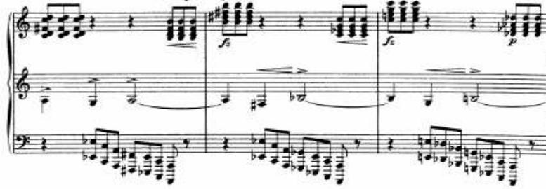
شكل (٩) يوضح التدوين على ثلاثة مدرجات موسيقية في Fantasia Contrappuntistica

كما استخدم بوزوني أيضا ثلاثة مدرجات موسيقية للتدوين في العديد من مؤلفاته للبيانو ومنها All' Italia و choralvorspiel و Berceuse و Fantasia Contrappuntistica كما يوضح شكل (٩) .