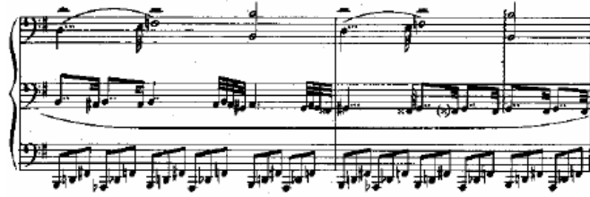
شكل (٧) يوضح التدوين على ثلاثة مدرجات موسيقية في البرليود رقم ١٠

كما استخدم كارا كاراييف بعض الخصائص السابقة من حيث استخدام ثلاثة مدرجات موسيقية للتدوين في العديد من مؤلفاته للبيانو ، مثال ذلك البرليود رقم ١٠ ورقم ٢٢ من مجموعة البرليود التي ألفها في الفترة من ١٩٥١ - ١٩٦٣ كما في شكل (٧) .