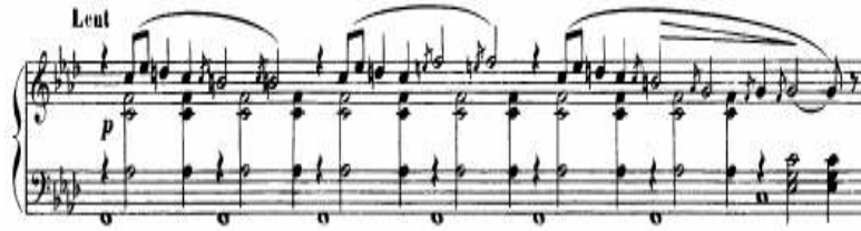
شكل (٣) يوضح عدم استخدام ميزان وخطوط موازير في مؤلفته Gnessiennes

وقد استخدم ايريك ساتي بعض هذه الخصائص وذلك في العديد من مؤلفاته للبيانو مثل مقطوعات باردة Heures Seculaires et Instantanees , Gnessiennes , Pièces froides حيث لم يستخدم ميزان وخطوط موازير كما في شكل (٣)