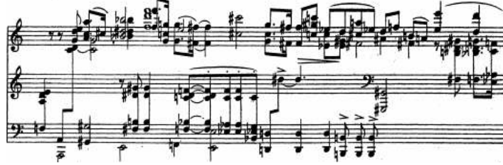
شكل (٦) يوضح التدوين على ثلاثة مدرجات موسيقية في الصوناتا رقم ٢ بعنوان Concord .

بالإضافة إلى استخدامه لثلاثة مدرجات موسيقية للتدوين كما يوضح شكل (٦)