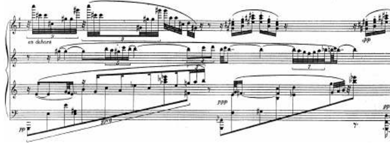
شكل (٢) يوضح التدوين على ثلاثة مدرجات موسيقية في المؤلفته بعنوان حديقة العطور

وقد استخدم ايريك ساتي بعض هذه الخصائص وذلك في العديد من مؤلفاته للبيانو مثل مقطوعات باردة Heures Seculaires et Instantanees , Gnessiennes , Pièces froides حيث لم يستخدم ميزان وخطوط موازير كما في شكل (٣)