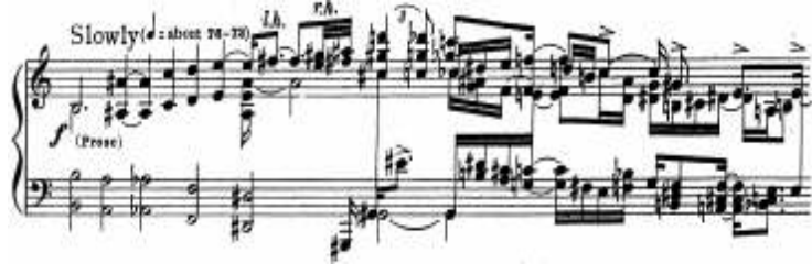
شكل (٥) يوضح عدم استخدام ميزان وخطوط موازير في الصوناتا رقم ٢ بعنوان Concord

بالإضافة إلى استخدامه لثلاثة مدرجات موسيقية للتدوين كما يوضح شكل (٦)