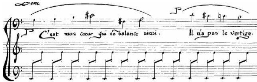
شكل (٤) يوضح التدوين على ثلاثة مدرجات موسيقية في مؤلفته بعنوان الأرجوحة

كما استخدم ثلاثة مدرجات موسيقية في مؤلفته بعنوان الأرجوحة La Balancoire من مجلد يضم عشرون مقطوعة قصيرة للبيانو بعنوان الرياضة والترفية Sports et Divertissements عام ١٩١٤ كما في شكل (٤).